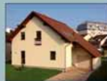
Vzorový dům OLOMOUČ